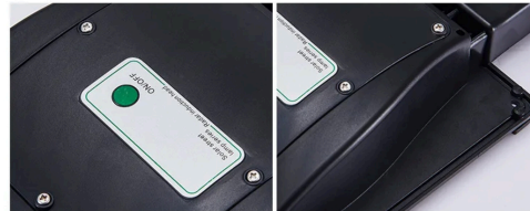
SENSOR DE MOVIMIENTO