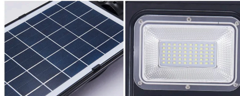
PANEL SOLAR INCLUIDO